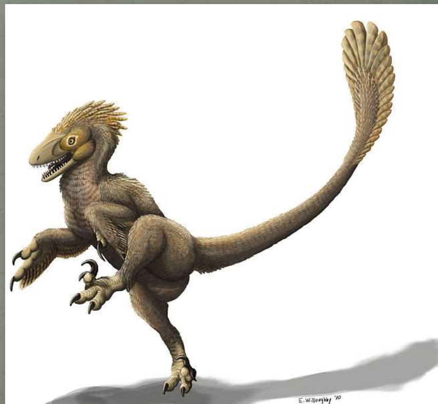
Balaur bondoc - Velociraptor